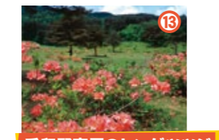
兎和野高原のレンゲツツジ

日本海が一望できる絶景スポット。「恋人の聖地」にも認定されている。 ◆見頃: 4月上旬 ◆兵庫県美方郡新温泉町芦屋 城山園地 (問) 浜坂観光協会 0796-82-4580