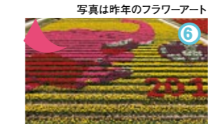
たんとうチューリップまつり

関西花の寺第六番札所「但馬のぼたん寺」として親しまれている。 ◆見頃: 4月下旬～5月上旬 ◆兵庫県豊岡市日高町荒川 22 (問) 隆国寺 0796-44-0005