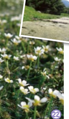
田君川のバイカモ群落

1万本を超えるレンゲツツジが自生している。 ◆見頃: 5月中旬～下旬 ◆兵庫県美方郡香美町村岡区宿兎和野高原 (問) 兎和野高原野外教育センター 0796-94-0211