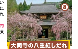
大同寺の八重紅しだれ

坑道から史跡生野銀山の駐車場にかけて数千本のヒカゲツツジが自生している。 ◆4月上旬～中旬 ◆兵庫県朝来市生野町小野 33-5 (問) (株) シルバー生野 079-679-2010