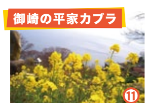
御崎の平家カブラ

山陰海岸国立公園内の中にあり、眺望が素晴らしい。 ◆見頃: 4月上旬～中旬 ◆兵庫県美方郡香美町香住区一日市 岡見公園 (問) 香住観光協会 0796-36-1234