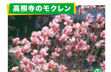
高照寺のモクレン

日本海を見下ろす高台にある御崎(みさき)地区に咲く。同地には落人伝説が伝えられ、平家の武将がこのカブラで飢えをしのいだといわれている。 ◆見頃: 4月上旬 ◆兵庫県美方郡香美町香住区余部 御崎地区 (問) 香住観光協会 0796-36-1234