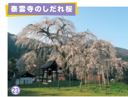
泰雲寺のしだれ桜

西日本最大級のエドヒガンザクラの枝垂。大きな枝を広げた姿は幻想的!県指定天然記念物。 ◆見頃: 4月上旬～中旬 ◆兵庫県美方郡新温泉町竹田 (問) 温泉町観光協会 0796-92-2000